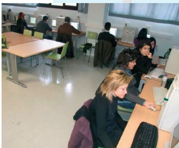
IES DOÑA JIMENA (GIJÓN)

Queremos agradecer también desde aquí la colaboración que nos han prestado los centros docentes con sus medios y equipos.