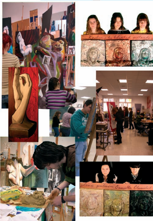
MONTAJE ALUMNADO BA

“La perspectiva malva del Dibujo” título de la experiencia presentada, describe como incluir la perspectiva de género en el quehacer diario, haciendo reflexionar al alumnado sobre estereotipos, visibilizando a la mujer como parte fundamental de la Historia pasada y presente, compartiendo trabajos, materiales y espacios, mati-