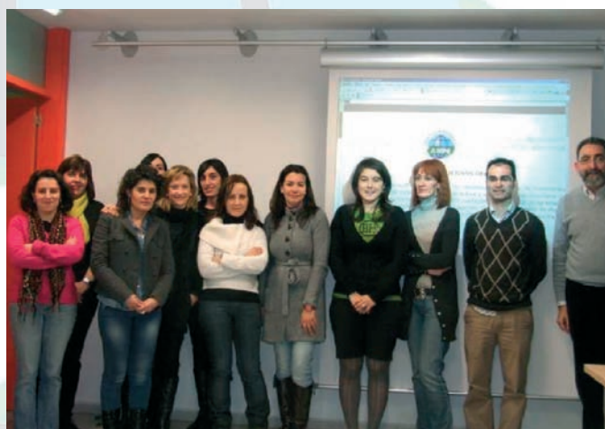
IES ALFONSO II (OVIEDO)