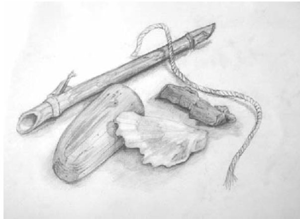
Dibujo: "Bodegón" de Guillermo Alonso. Esc. de Arte de Oviedo.