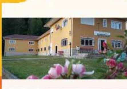
Escuela Hogar Reconquista Cangas de Onís

Se crearon como un recurso educativo residencial, que, en el caso de Asturias, evitaba el tener que ir y volver cada día a los domicilios, salvando así las serias dificultades de hacerlo y que en ocasiones se hacía imposible, como en el caso de neva-